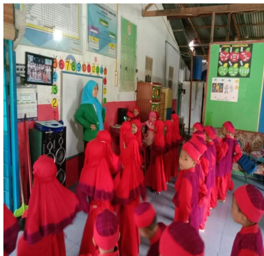
Gambar. 2 Observasi Kecerdasan Kinestetik Kegiatan Tari Kreasi

Keadaan pada Siklus I belum mencapai target penelitian 80%. Maka penelitian melakukan Siklus II untuk mencapai target sebagai perpanjangan percobaan sehingga pembuatan rencana kembali yang terkendala di Siklus I