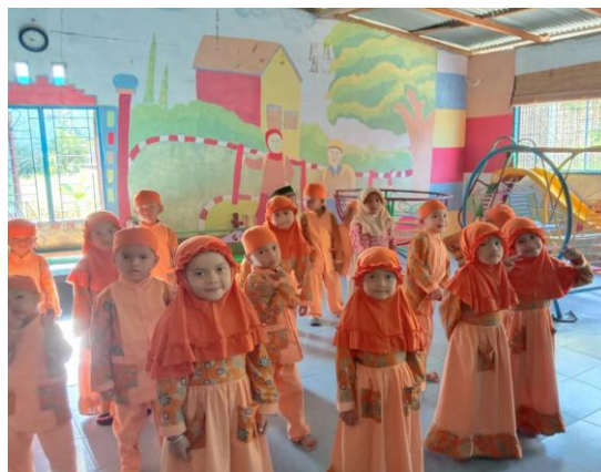
Gambar. 1 Kegiatan Kecerdasan Kinestetik

Hasil perhitungan prasiklus bahwa kecerdasan kinestetik prasiklus di Taman Kanak-kanak Islam Terpadu Ananda Putri Batang Kuis memperoleh hasil 35%. Hal ini masih kurangnya kecerdasan kinestetik sehingga perlu dilakukan tindakan lebih lanjut.